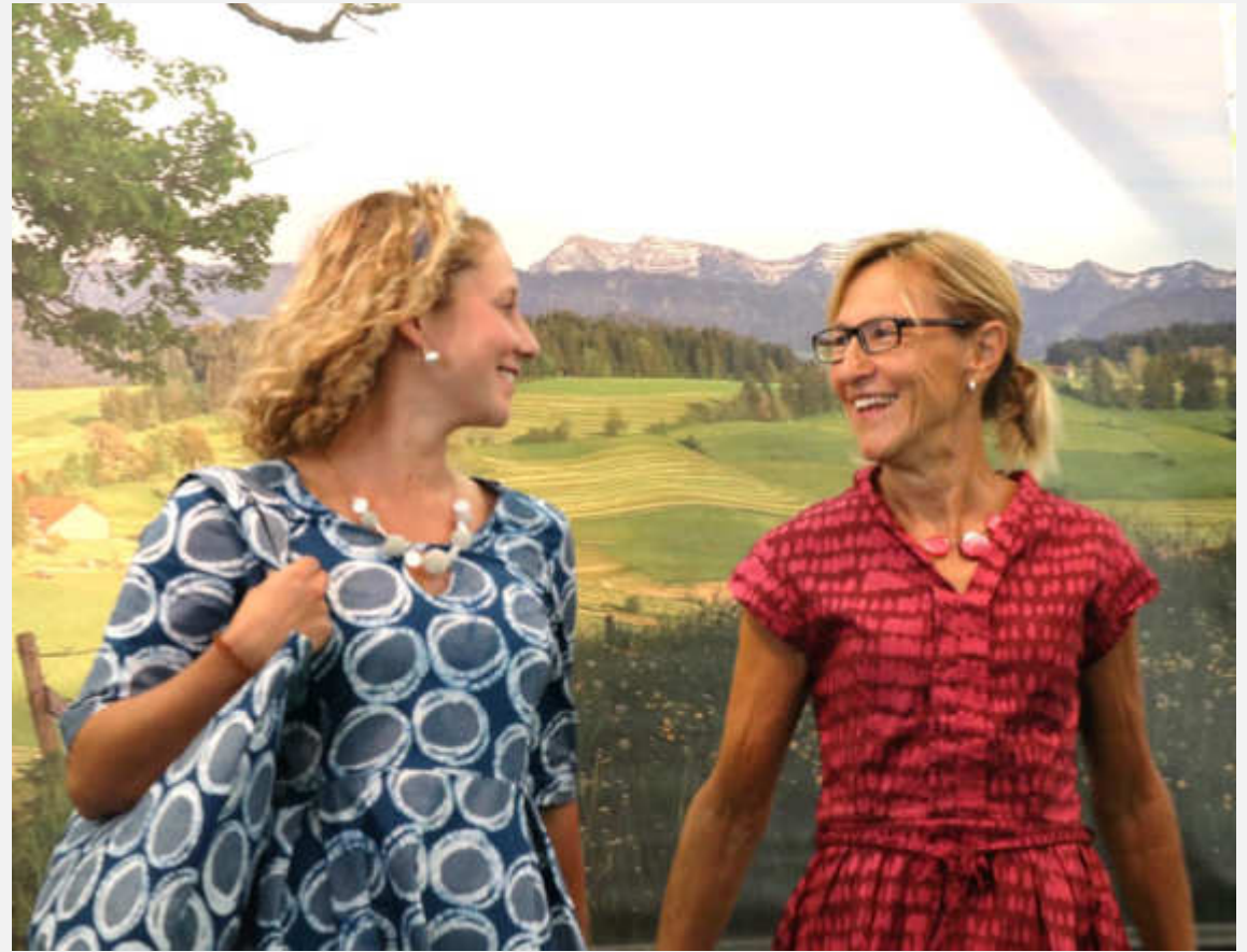
Batik-Stoffe aus Ghana

Ledertaschen aus Indien, Panamahut aus Kolumbien