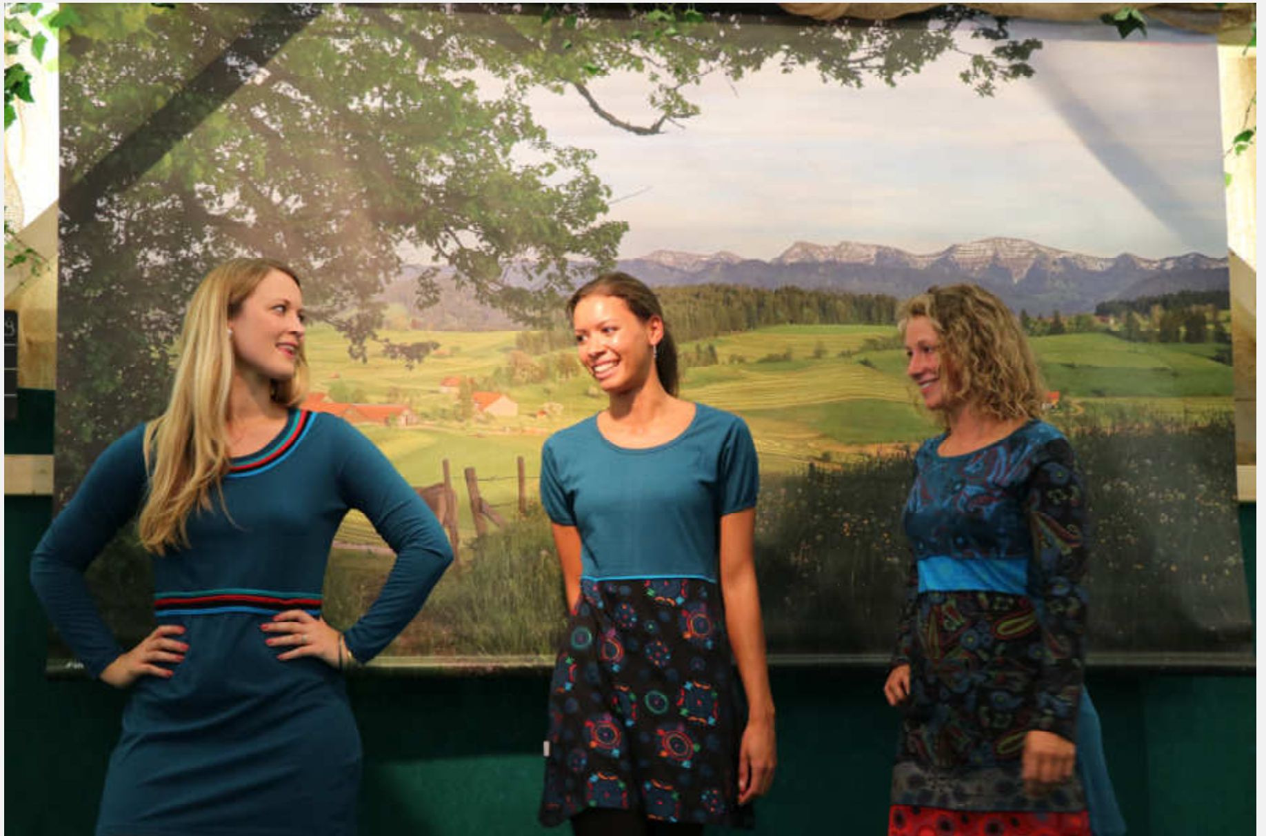
bunt bedruckte Kleider aus Nepal