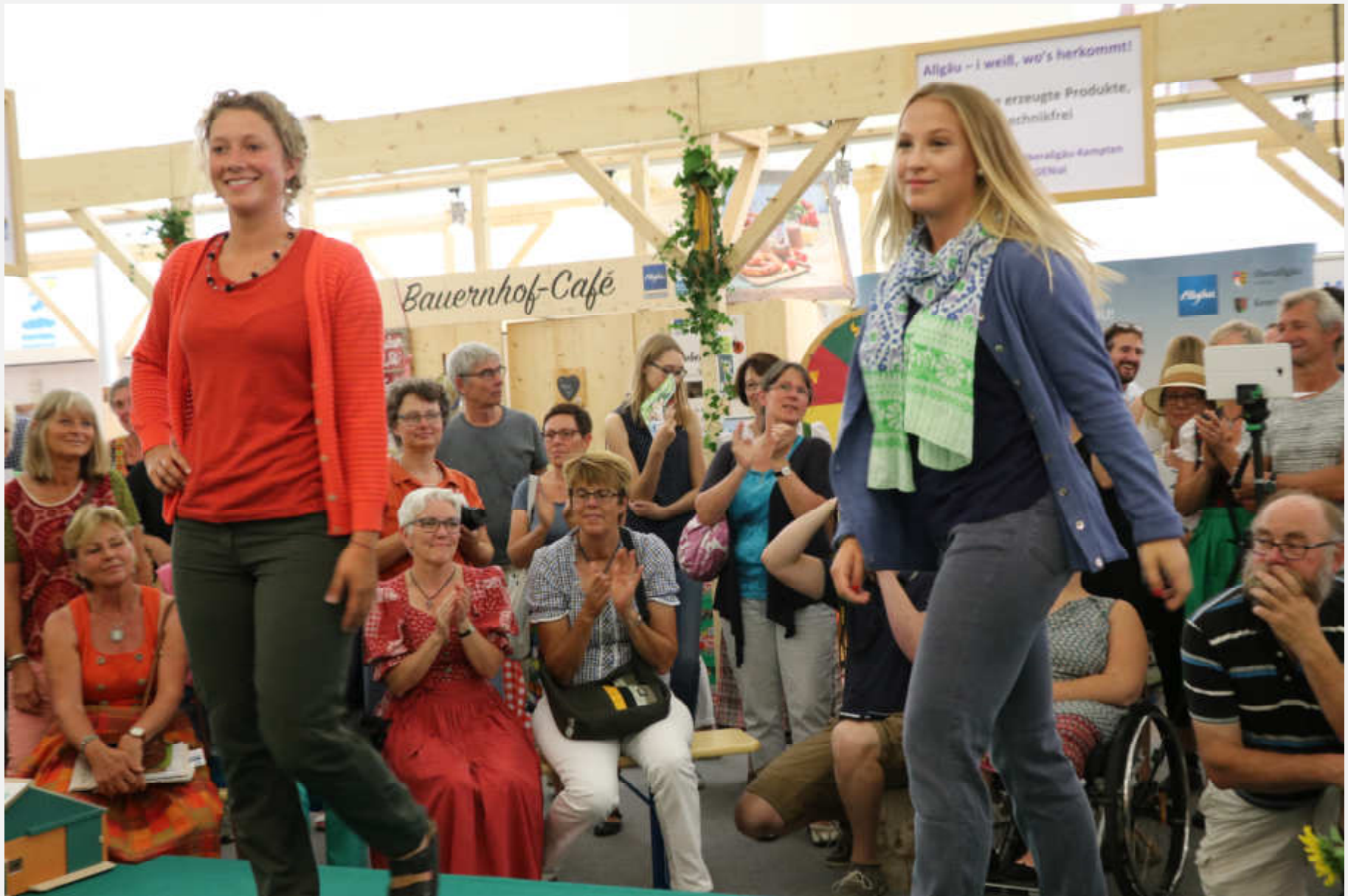
Shirts aus Hanf und Baumwolle, Tücher aus Seide und Baumwolle