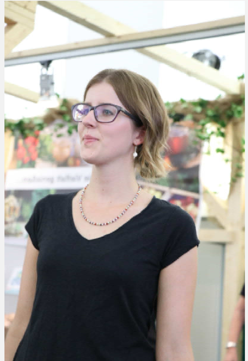
Shirts ärmellos oder kurzärmelig