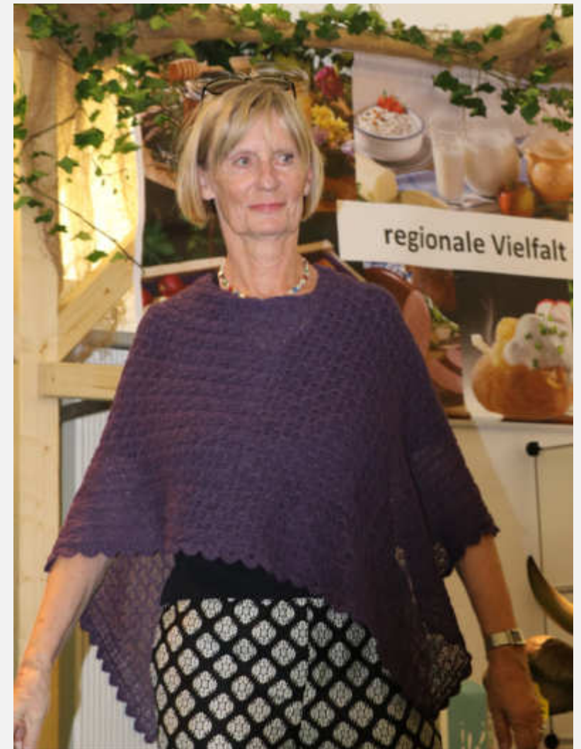
Ponchitos aus Baby-Alpaka - federleicht und warm