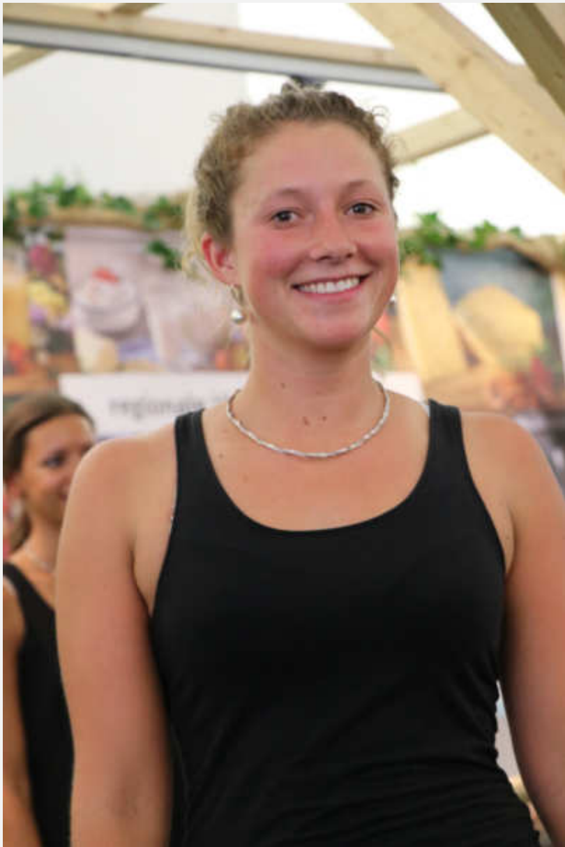
Silberschmuck aus Mexiko